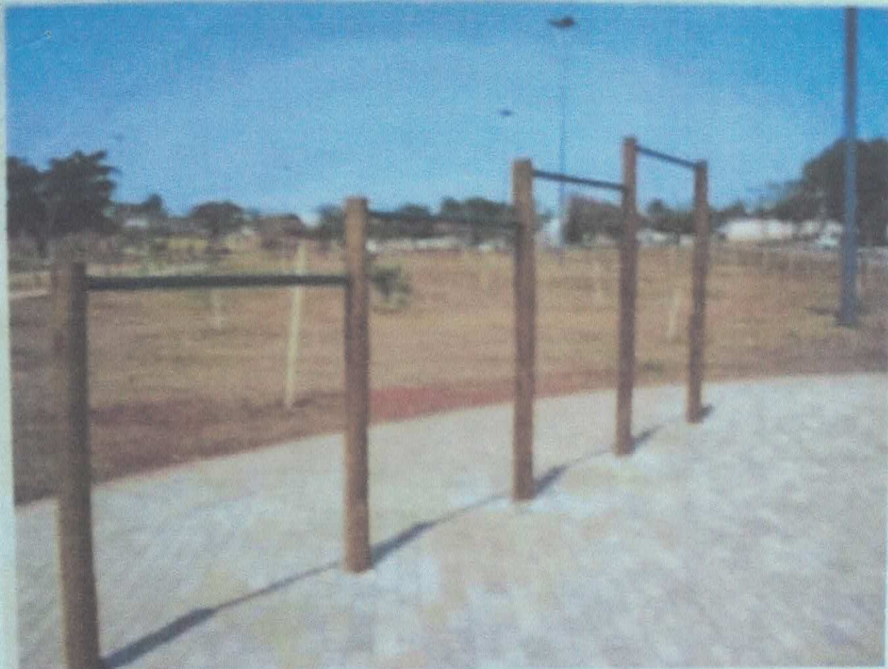
Conjunto de Barra Fixa 4 Alturas